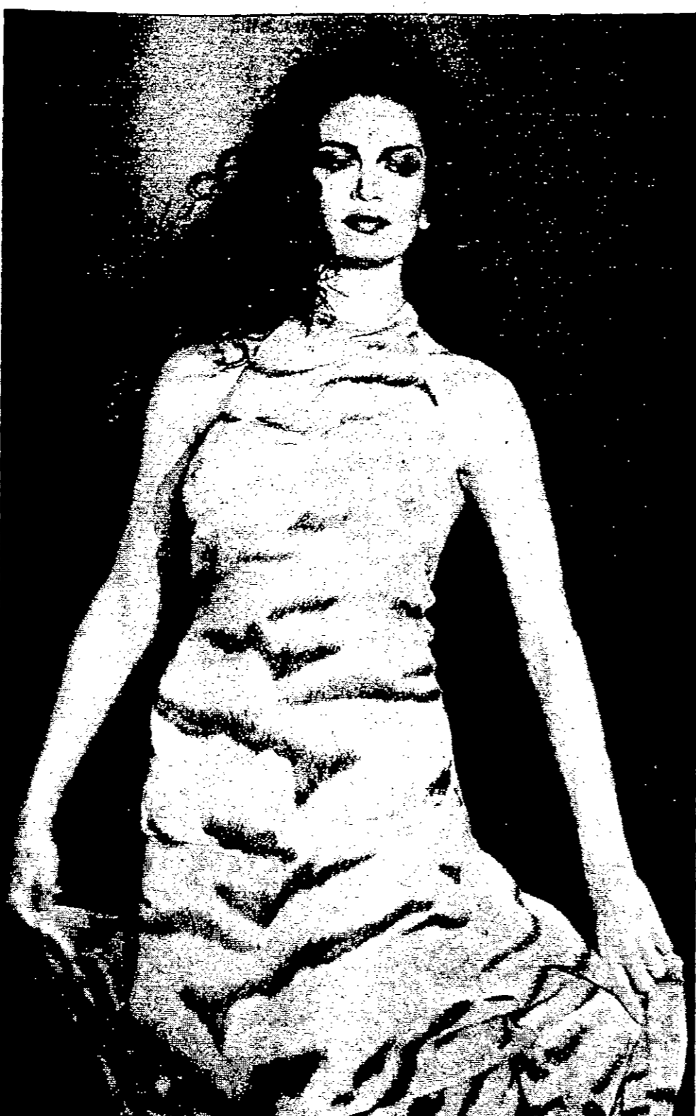
تصميم جديد قدمته هذه العارضة اسم في ميلانو ضمن عروض المصمم روبرتو كافالي للملابس الجاهزة.

واشنطن - رويترز - تخرت شبكة (سي ان ان) ان الرئيس الامريكي بيل كلينتون سيعلن اليوم الخميس ان الكونغرس سيوافق على تعيين ضابطة امريكية تقود مكوك فضاء في اولى رحلاتها في عام 1998. واشتمت كوليتز في ادارة الطيران والفضاء (ناسا) عام 1990 واصبحت رائدة فضاء في تموز (يوليو) من العام التالي. وقالت (سي ان ان) ان كوليتز كانت اول امرأة تشارك في رحلة بالوك وانها شاركت في رحلتين في شباط (فبراير) عام 1996 و (مايو) عام 1997 التحقت بالوك في محطة الفضاء الروسية مير.